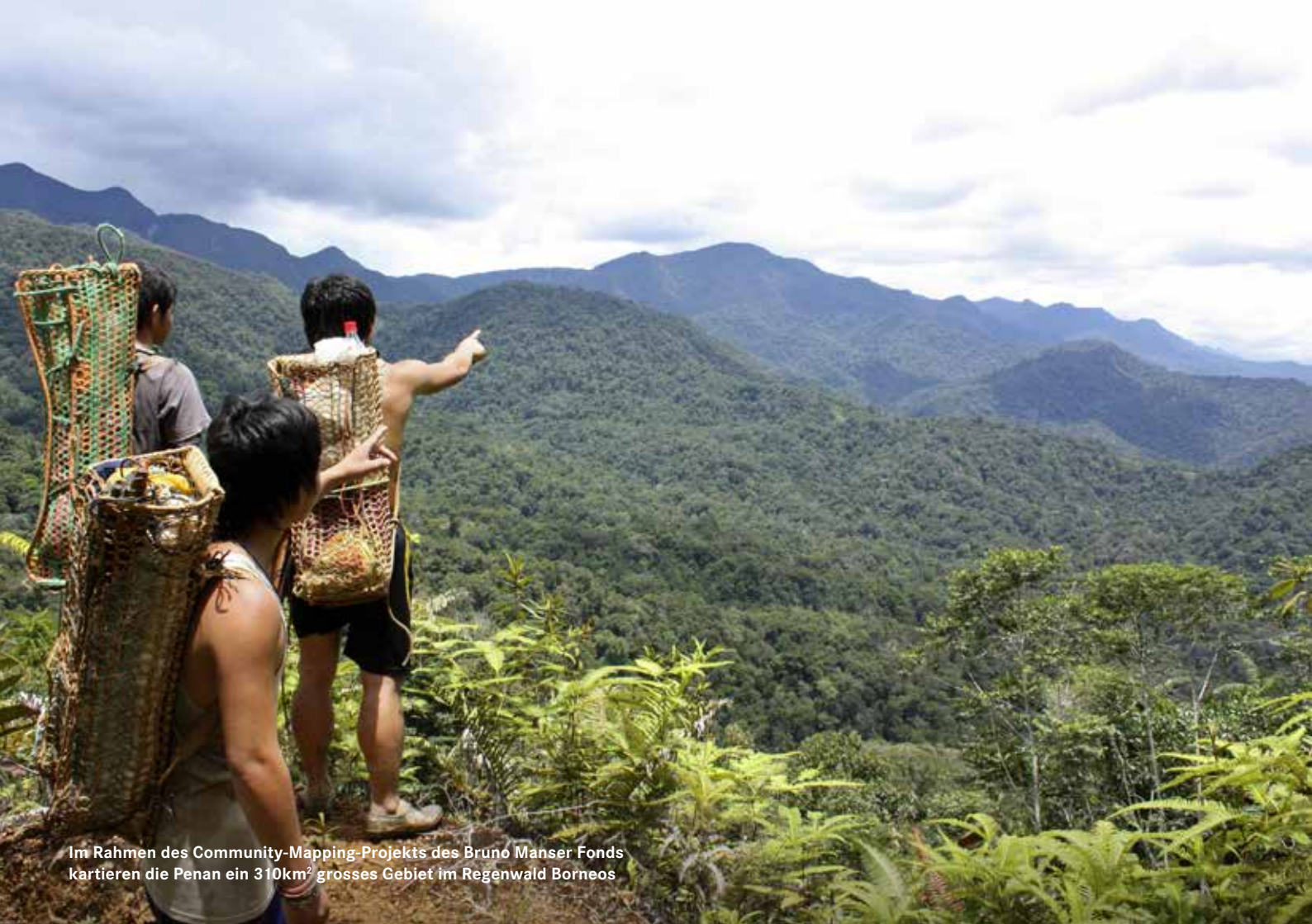
Im Rahmen des Community-Mapping-Projekts des Bruno Manser Fonds kartieren die Penan ein 310km 2 grosses Gebiet im Regenwald Borneos