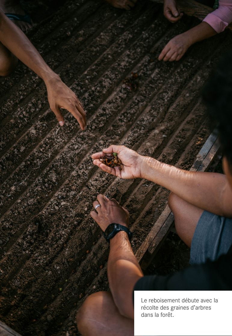
Le reboisement débute avec la récolte des graines d'arbres dans la forêt.