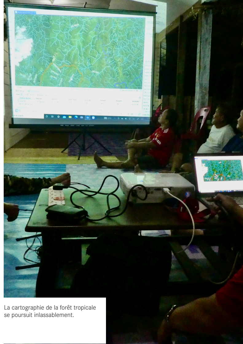
La cartographie de la forêt tropicale se poursuit inlassablement.