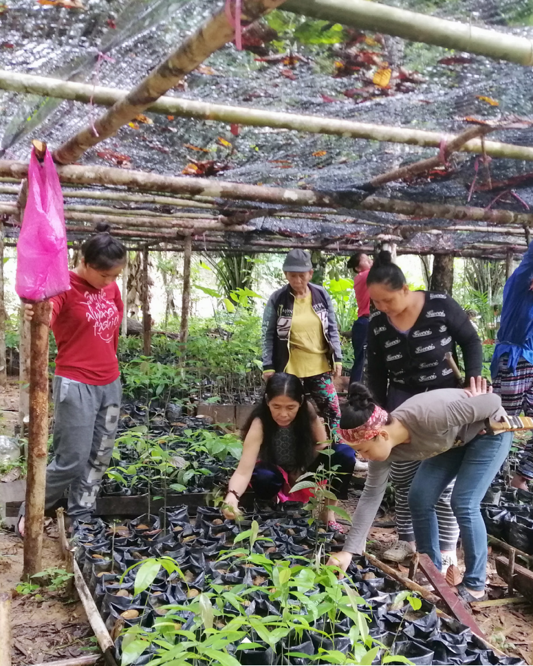
La pépinière de Long Kerong: u cours des mois à venir, quelque 3000 jeunes plants devraient être mis en terre.