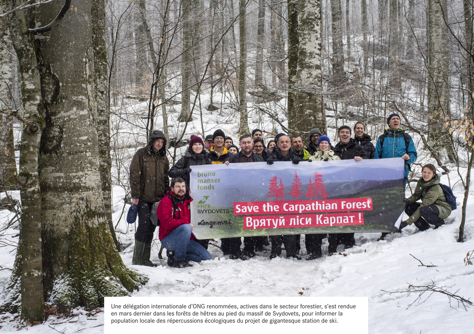
Une délégation internationale d'ONG renommées, actives dans le secteur forestier, s'est rendue en mars dernier dans les forêts de hêtres au pied du massif de Svydovets, pour informer la population locale des répercussions écologiques du projet de gigantesque station de ski.