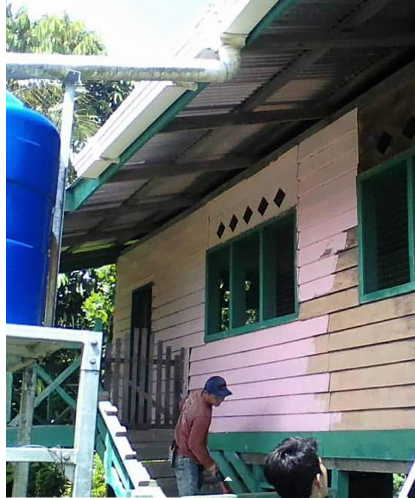
L'école de base de Long Bangan: le bâtiment scolaire datant de 2012, qui accueille actuellement 15 enfants pour l'enseignement en Penan, a été rénové l'an dernier.