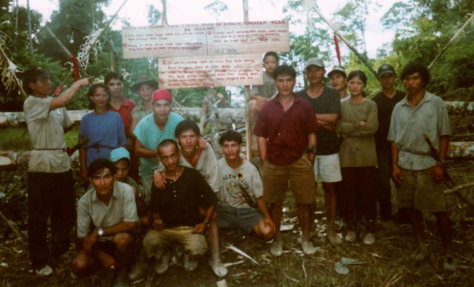
Depuis février 2004, les Penan de Long Benali se défendent avec succès contre le déboisement de leur forêt pluviale (photo mars 2006).